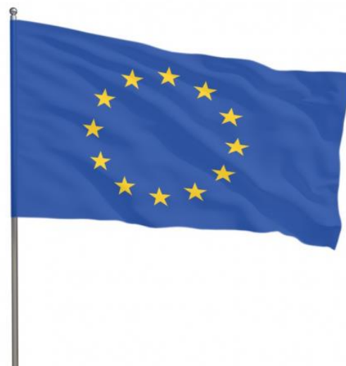
Eén Europese wet